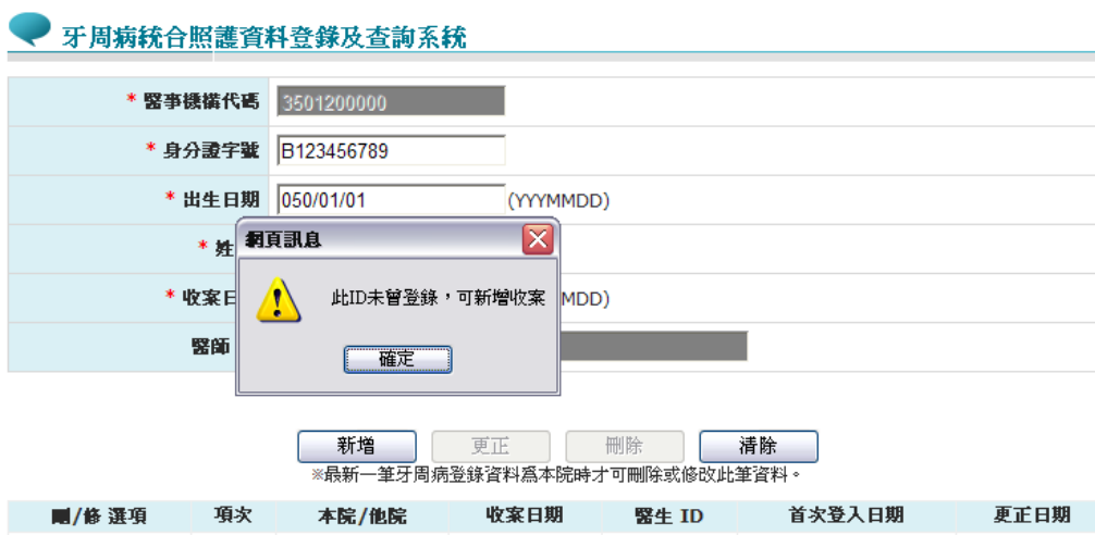
圖貳-8 牙周病統合照護資料登錄及查詢