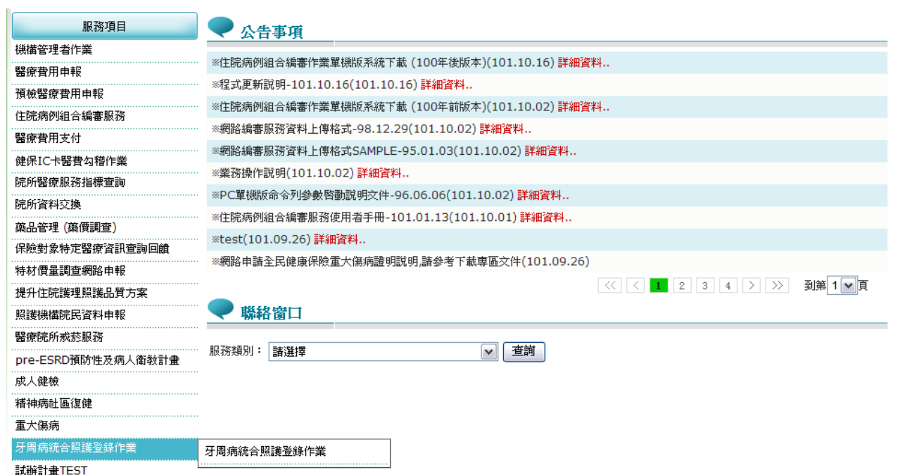
圖貳-3 健保資訊網服務系統 (VPN) 我的首頁