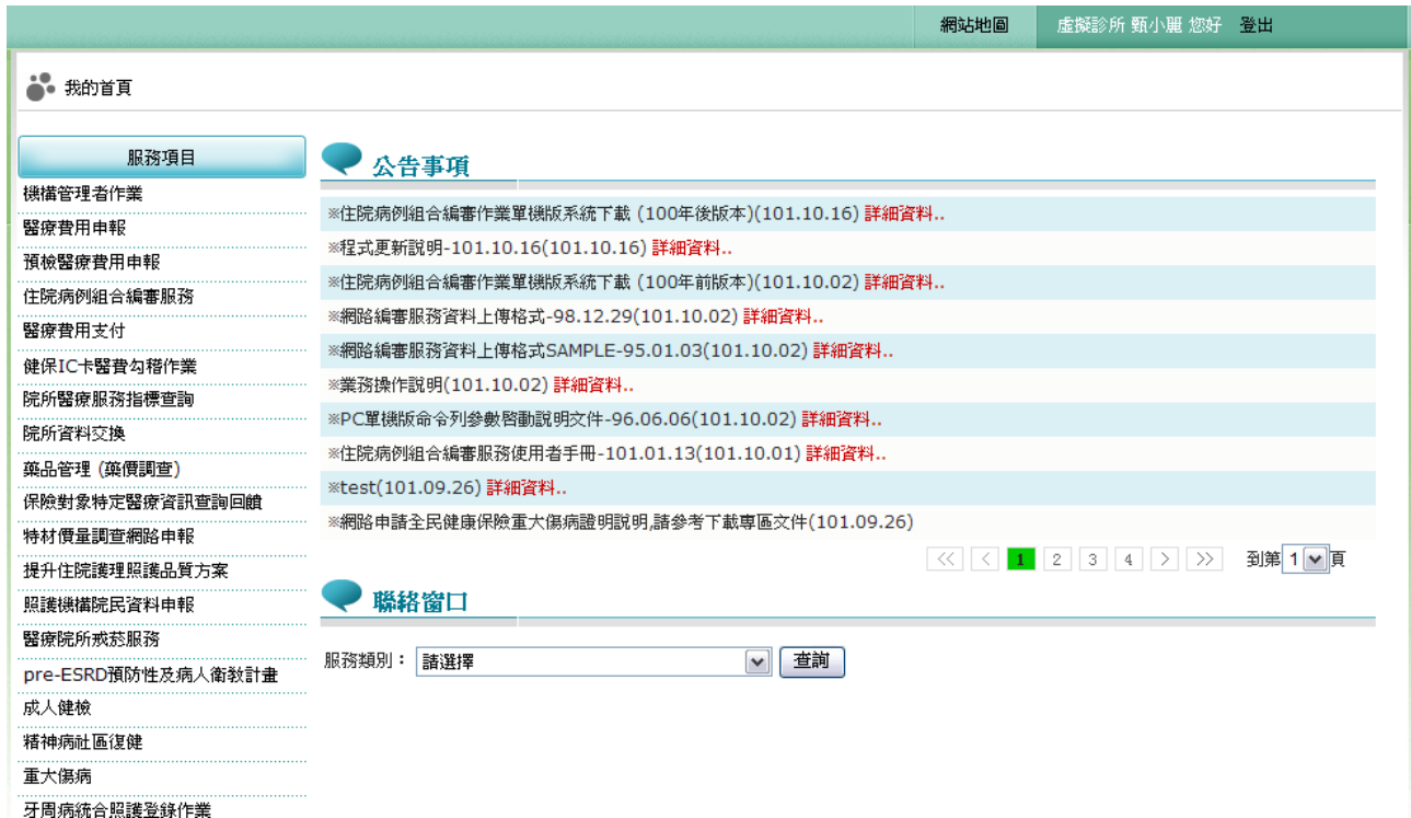
圖貳-2 健保資訊網服務系統 (VPN) 我的首頁