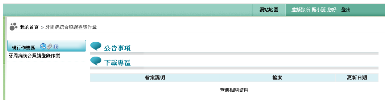
圖貳-4 現行作業區業務公告

2. 當游標移至「牙周病統合照護登錄作業」的作業時，會將屬於此業務的相關作業向右展開，當點選任一作業，系統即進入「現行作業區」，並執行所點選的作業選項。