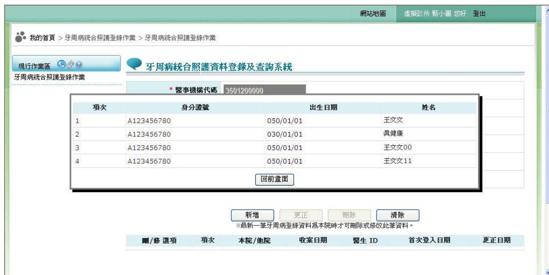
圖貳-7 歷史資料回覆畫面