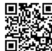
醫策會活動報名網站

學 分：提供醫策會教育訓練、公務人員終身學習時數 3.5 小時，並適用於申請全民健康保險醫院總額品質保證保留款之課程積分。